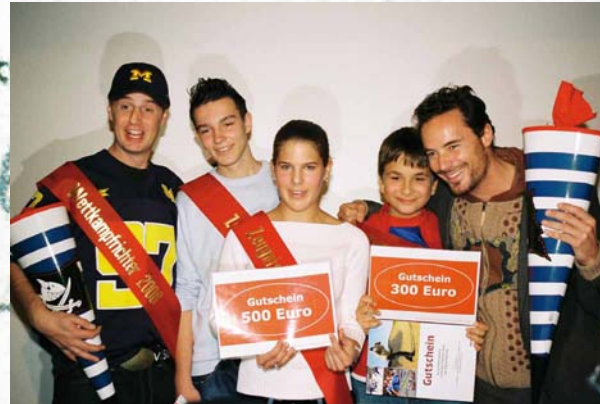
Die Gewinner 2008