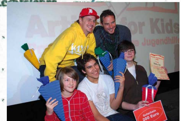
Die Gewinner 2009

„Wir unterstützen den Münchner Zeugnis-Wettbewerb, weil wir einfach an die Kids glauben. Es steckt meistens so viel mehr in ihnen, als sie selbst meinen. Deshalb an alle Checker und solche die es werden wollen - gebt Gas und zeigt ihnen, was ihr drauf habt!“